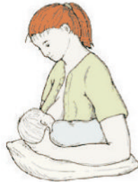
PELOTA DE FUTBOL